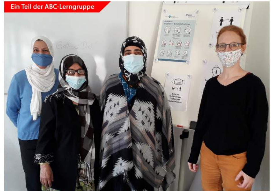
Ein Teil der ABC-Lerngruppe

Das Jahr 2020 war ein besonderes. Es hat alle Menschen vor große Herausforderungen gestellt. Das Lernen in Gruppen war zeitweise gar nicht möglich. Der ABC – Lerntreff fand trotzdem zwischen den „Lockdowns“ statt. Die treuen Teilnehmerinnen kamen regelmäßig in kleinen Gruppen bis 3 Personen, um weiter lernen zu können. Danke an alle Frauen, die motiviert waren und den Lerntreff mit Leben gefüllt haben.